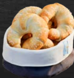
1040283 Midi-Briochekipferl 40 Stk. à 50 g / gr. Karton 2 min fertig backen*