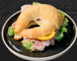
1011224 Midi-Frühstückskipferl 40 Stk. à 50 g / gr. Karton 2 min fertig backen*